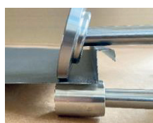
Profilhöjd 28 mm.

DET SKA VARA LÄTT ATT VARA PROFESSIONELL